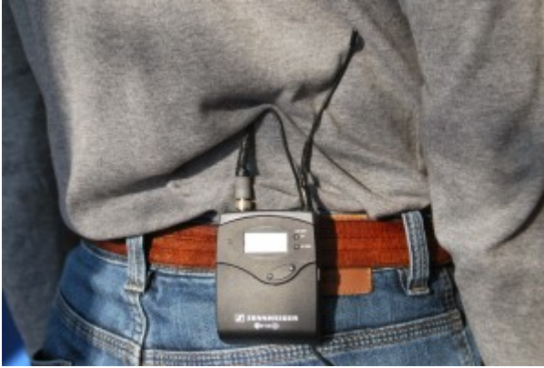
Kişiye bağlı verici