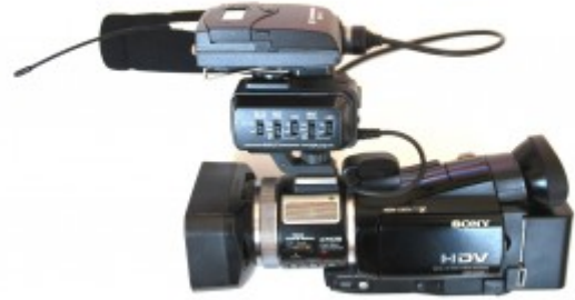
Foto : Transmitter, alıcı ve mikrofon (sol) ve kameraya bağlanan alıcı