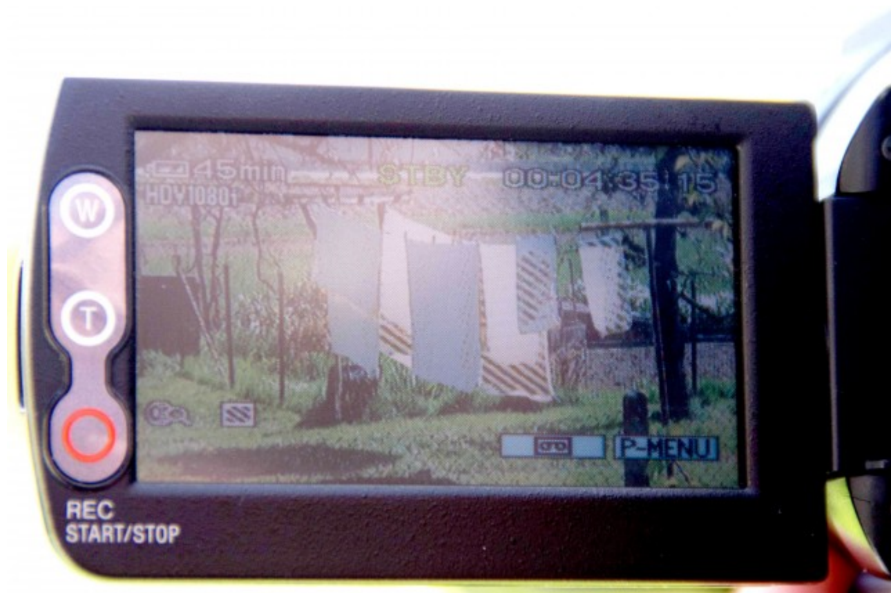
Zebra na ekrančku označi dele slike, ki so presvetljeni

predele, ki so po stopnjah manj beli. Manjši delež zebre na sliki je v redu, vendar je odvisno od tega, kaj snemamo. Glavni objekt ali oseba na sliki ne sme biti preosvetljena (na njej ne sme biti vidna zebra), razen če je bele barve oz. nosi belo obleko. Kakšna stvar v okolici pa je včasih lahko bolj svetla (ima zebro), npr. beli predmeti, avtomobili, hiše, oblaki na nebu. Kadar snemamo obraz belca, nastavimo zebro na 80 in pazimo, da le-ta ni vidna na obrazu. Količino zebre oz. osvetlitve lahko zmanjšaš z zapiranjem zaslonke.